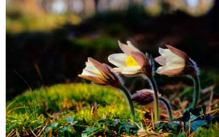
Die Frühlings-Küchenschelle (Pulsatilla vernalis) ist eine Art, die durch Waldbrände begünstigt wird.

Arten von höheren Pflanzen wurden vorgefunden. In den Fichtenbeständen können anspruchsvollere Kräuter wie Frühlings-Platterbse, Leberblümchen, Waldveilchen und Wunderveilchen auftreten. Charakteristische Arten sind hier Nickendes Wintergrün und Netzblatt. Im Sumpfwald nordwestlich vom Stora Idgölen wachsen u.a. Schlangenzunge, Straußblütiger Gilbweiderich und Sumpfeveilchen sowie nördliche Pflanzen wie Langblättrige Sternmiere und Lolch-Segge. Auf der Wasseroberfläche breiten sich Blätter von Seerosen und Schwimmendem Laichkraut aus. In der Bachschlucht wachsen das seltene Gras Wald-Schwingel und Alpen-Hexenkraut. Im kargen Kiefernwald auf der Anhöhe gedeiht die seltene Frühlings-Küchenschelle. Die Bodenvegetation wird hier ansonsten von Heidekraut und Immergrüner Beerenraube dominiert.