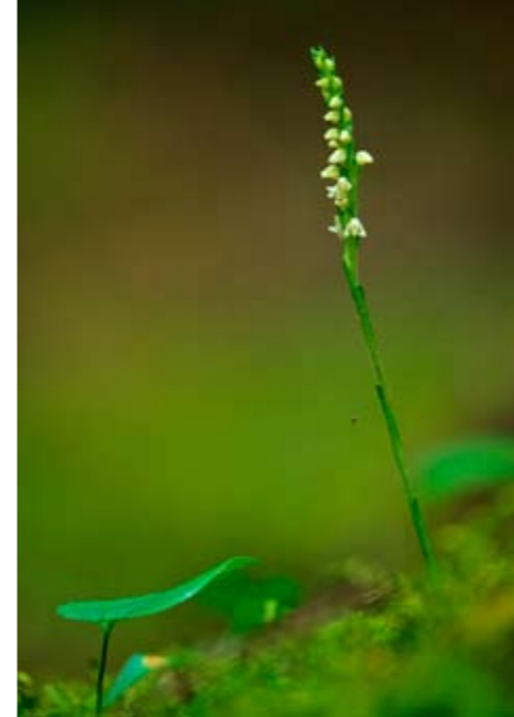
Netzblatt ( Goodyera repens ) ist eine charakteristische Art in Norra Kvill.

Die schwedischen Nationalparks dienen dazu, größere Gebiete in ihrem natürlichen Zustand für Forschungs- und Freiluftzwecke zu bewahren. Sie sollen der Öffentlichkeit zugänglich gemacht werden, ohne dass ihr ursprünglicher Charakter verloren geht.