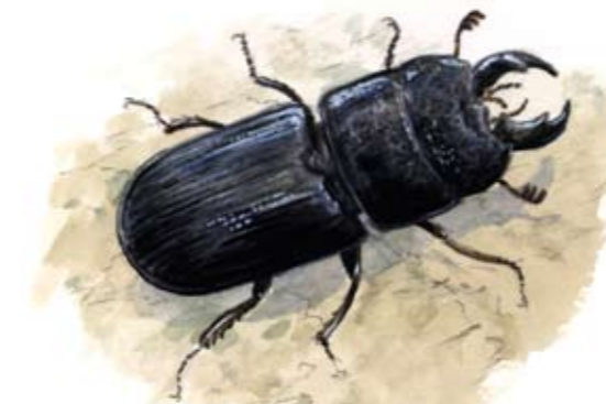
Sperlingskauz (Glaucidium passerinum)

Die Flora ist für ein Nadelwaldgebiet ungewöhnlich reich. Gut 200 Moose, 100 Flechten und mehr als 200